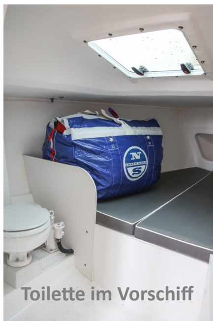
Toilette im Vorschiff