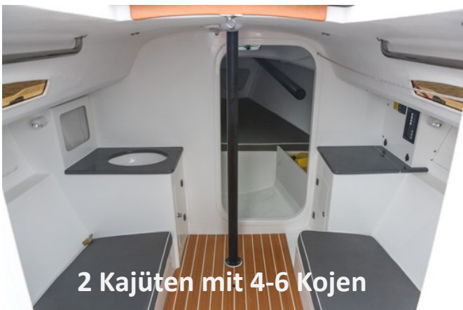
2 Kajüten mit 4-6 Kojen