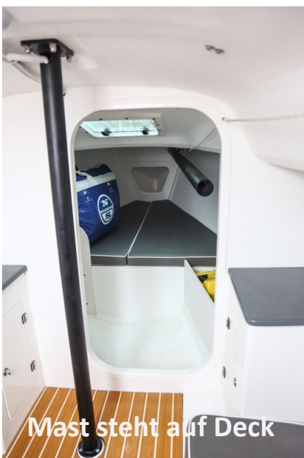
Mast steht auf Deck